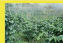
<公平貿易合作社蔭栽咖啡田>