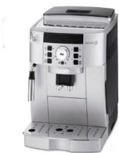
DeLonghi 風雅型自動咖啡機

尺寸(cm)：23.8 x 43 x 34mm(L*H*D) 重 量：9.1kg 功 率：1250w 水 箱容量：1800cc 豆槽容量：250g 電 壓：110v 快速鍋爐：義大利製造